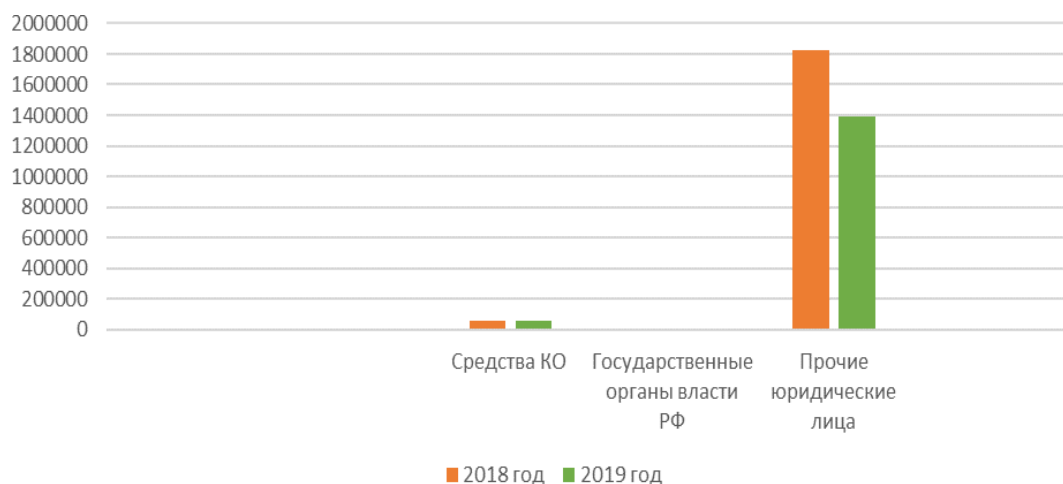
Рисунок 2.3 - Анализ динамики средств на расчетных счетах клиентов - юридических лиц в Банке ВТБ (ПАО)

разъясняющую изображенную функциональную зависимость, примененные в диаграмме обозначения, которую следует размещать под диаграммой. Легенду располагают под диаграммой по центру без рамки. Пример: