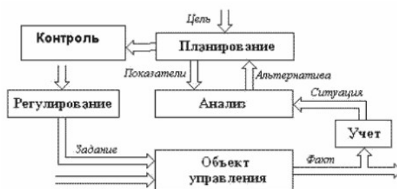
Рисунок 2 – Технология процесса управления

Нумерация листов пояснительной записки должна быть сквозной для текста и приложений, начиная с титульного листа. Проставляется нумерация с третьего листа (титульный лист и задание не нумеруются). Номер листа проставляется справа внизу.