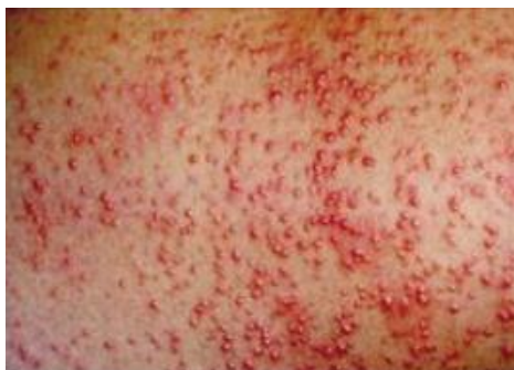
Рисунок 2 – Высыпания на коже, везикулопустулез

Нумерация листов пояснительной записки должна быть сквозной для текста и приложений, начиная с титульного листа. Проставляется нумерация с третьего листа (титульный лист и задание не нумеруются). Номер листа проставляется справа внизу.